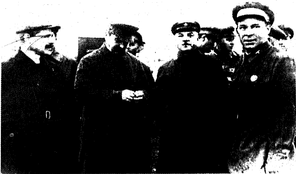
ستالين وإلى يساره المارشال فوروشيلوف وكبار ضباط الطيران.